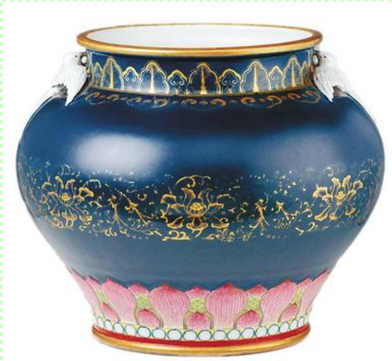
清乾隆霁青金彩海晏河清尊。